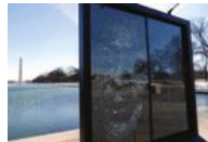
"Vice president Kamala Harris glass ceiling breaker".